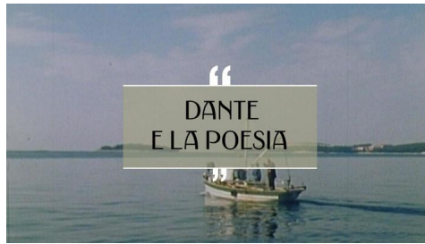
Un'immagine dal documentario "Dante e la poesia" TV Koper-Capodistria/TV Capodistria

21 e 25 marzo: due date che festeggiano una delle attività umane più antiche, la poesia. Da una parte il primo giorno di primavera coincide con la giornata Internazionale della poesia, dall'altra dal 2021 il 25 marzo si celebra il Dantedì, la data in cui gli studiosi presuppongono sia iniziato il suo viaggio nell'Aldilà raccontato dalla Divina Commedia. Per onorare entrambe le occasioni, la Facoltà di Studi Umanistici organizzerà la proiezione del documentario "DANTE e LA POESIA", ideato e condotto da Martina Vacci, frutto del lavoro compiuto nell'anno del settecentesimo anniversario della scomparsa del poeta.